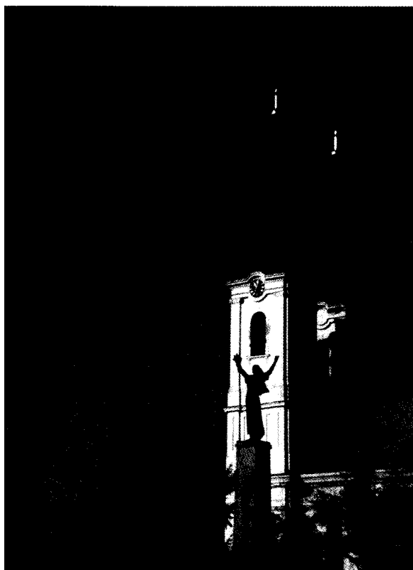
Szenttamási szerb templom és a partizán lány szobra

hűen csak a magyar történelem kereteiben, annak összefüggéseiben vizsgálhatók. A trianoni, illetve a jelenlegi államhatárok évszázadokkal való visszavetítése egyébként már sok bonyodalmat okozott a szomszédos országokban élő (sőt egyes magyarországi!) szerzőknek, melyek eredményeképpen olyan elképesztő megállapítások születtek, mint az idézett szlovák példa. Tanulságos egy szovjet-ukrán értelmezés az ÉszakKelet - Magyarországon 1831- ben lezajlott kolerázadáról: "Nagy felkelés tört ki 1831-ben. Szlovákiában (sic!) kezdődött, aztán átterjedt Magyarország jelentős részére és a Kárpátontúlra (sic!, ti. a jelenlegi Kárpátaljára). Ebben a felkelésben megnyilvánult az ukrán, magyar és szlovák nemzetiségű néptömegek szolidaritása!."