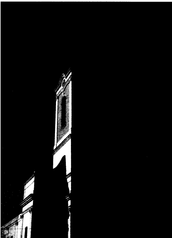
Római katolikus templom Szentlamáson