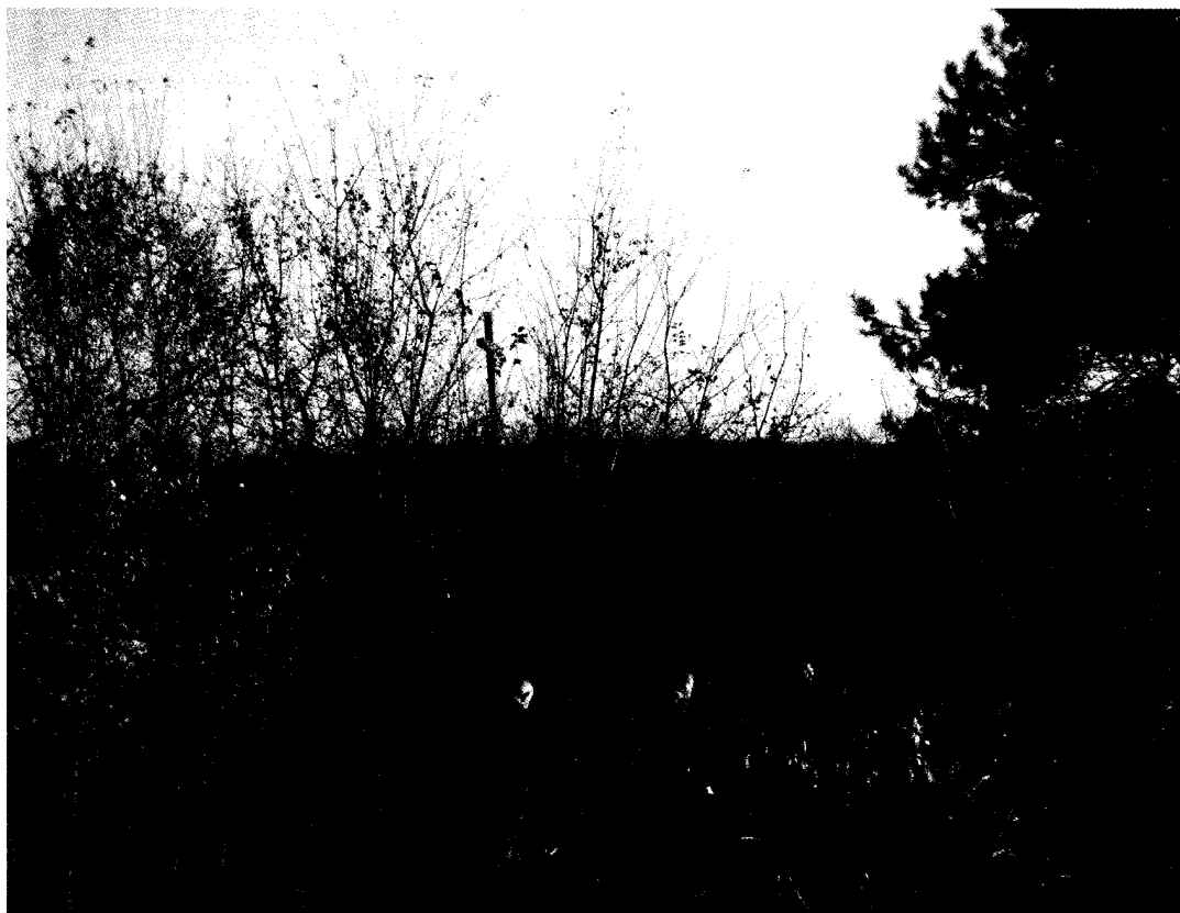
Zarándokok a Csonthalomnál, Bácsföldvár határában

Végül összegzésül: a kölcsönösség, a szomszédsági viszony javítása, a megbékélés érdekében a 21. század elején joggal elvárható, hogy szerb és román történetírás képviselői végre szembenézzenek nemzetük valódi múltjával. A saját szemszögükből tárgyilagosan tárják fel a több évszázados rác-, illetve oláhjárások magyarirtásának okait, körülményeit és máig tartó következményeit.